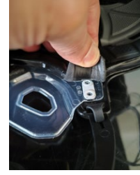
Kuva 1 Kiinnityselementti