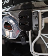
Kuva 4 Häkin asennus