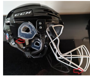
Kuva 5 Hybridisuojan avaaminen