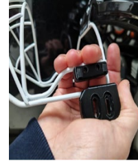
Kuva 3 Kiinnityskappaleet