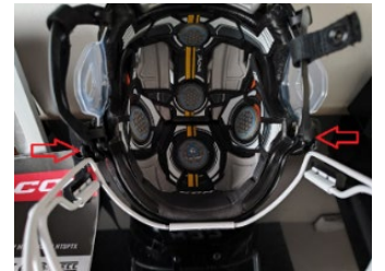
Kuva 6 Hybridisuojan kohdistaminen