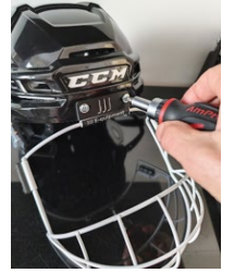
Kuva 2 Saranan kiinnitys